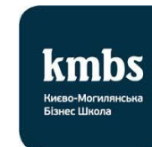
Києво-Могилянська бізнес школа, Україна, Школа глобальних ринків